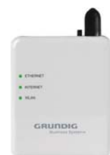
Als LAN oder WLAN Adapter