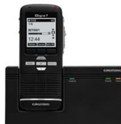
Für Digta Station

Le Mot GmbH Ringstraße 32 a 86911 Dießen am Ammersee Tel +49 (8807) 91678 Fax +49 (8807) 91670 eMail office@lemot.eu web www.lemot.eu